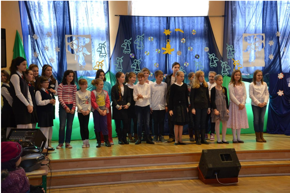
Wspólne zdjęcie finalistów festiwalu.