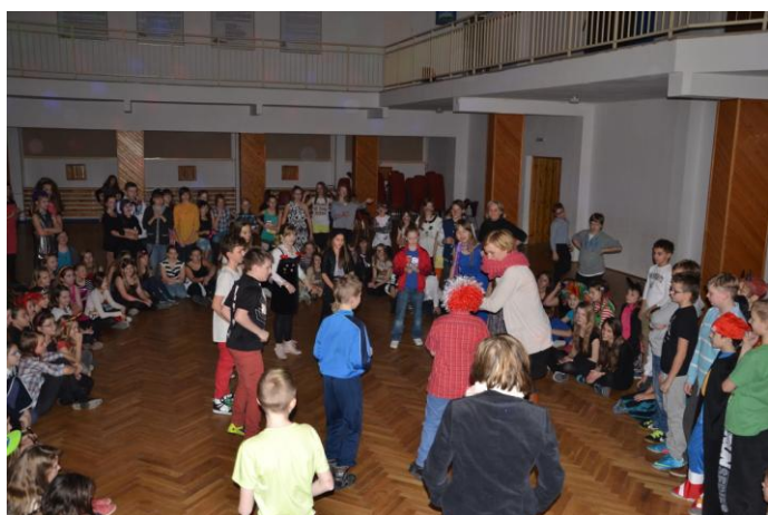
Jedna z konkurencji.

Przygotowane były konkursy, w których wszyscy bardzo chętnie uczestniczyli. Gdy ogłoszono konkurs, każdy od razu się zgłaszał!